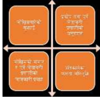
चित्र २ समुदायमा आधारित पुर्व चेतावनी प्रणालीका मुख्य अवयवहरू

राजपुर गाउँपालिका वर्षाले गर्दा अचानक आउने बाढीको कारण प्रायजसो धेरै प्रभावित हुने गर्दछ, त्यसैले गाउँपालिकाको बाढी पुर्वानुमान मुख्यतया वर्षाको श्रेसहोल्डमा आधारित छ ।